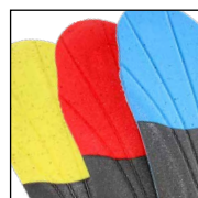
HAIX® Vario Wide Fit System