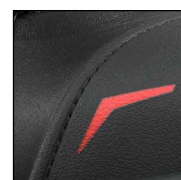
GÜK mit versenkten Nähten